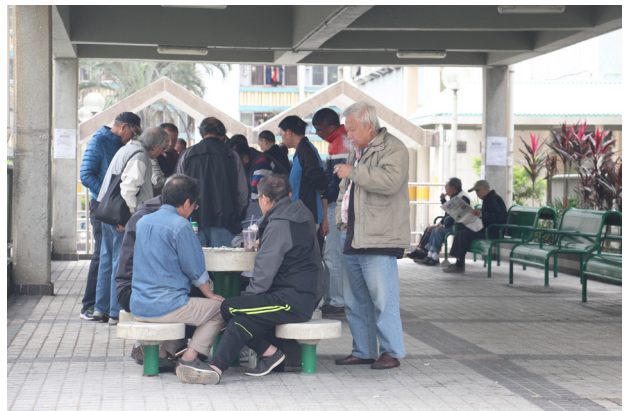
■廣福邨內有不少長者經常圍在一起聚賭，打發時間。